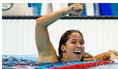
Ranomi Kromowidjojo (2011)